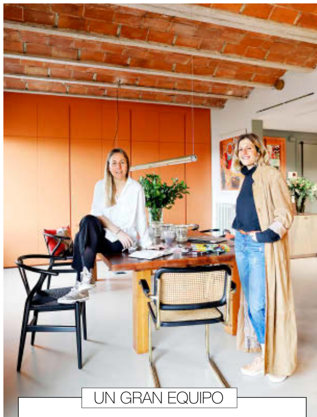
UN GRAN EQUIPO

El máximo atrevimiento se aplicó en la cocina y los cuartos de baño: “Muchas veces el cliente no quiere osadía, y tenemos que moderarnos. Sin embargo, en estos espacios normalmente nos dejan dar rienda suelta a nuestra creatividad,