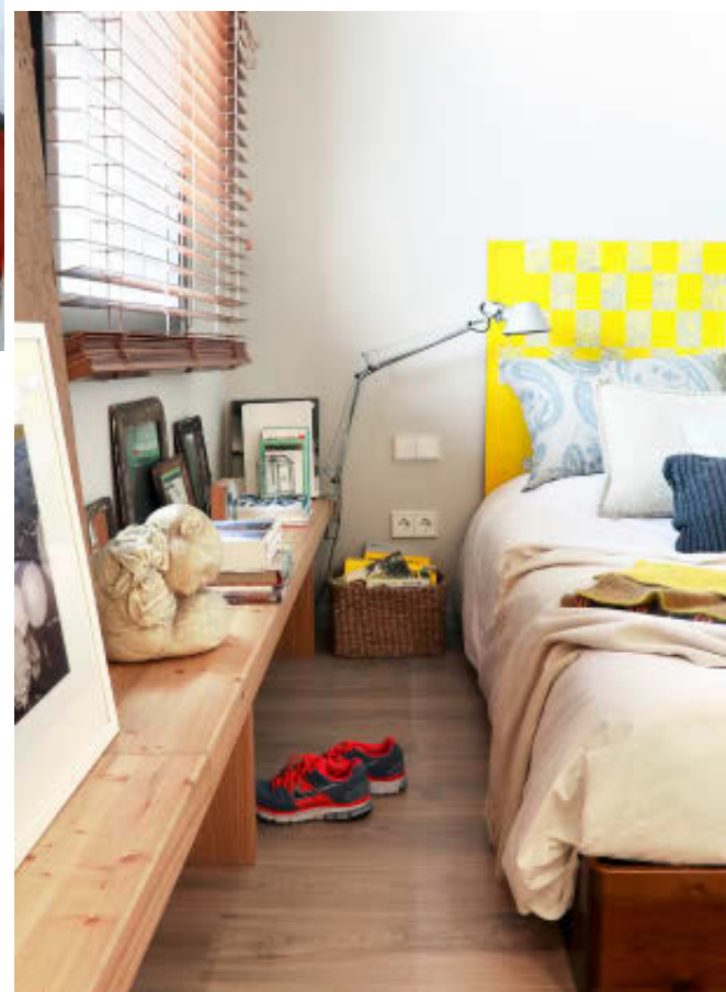
En el dormitorio principal, cabecero realizado por Cristina y su marido con listines telefónicos. El espejo del cuarto de baño se recuperó de un contenedor.