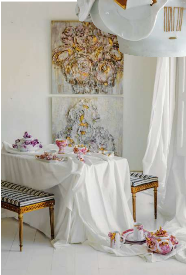
Coordinación: Mandarin e Verrier