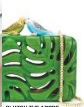
CLUTCH THE ADORE, DE SARAH'S BAGS