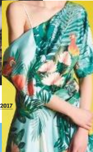
ROCHAS RESORT 2017