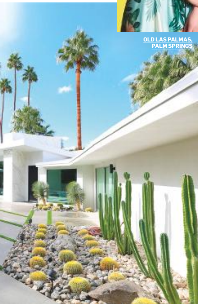
OLD LAS PALMAS, PALM SPRINGS