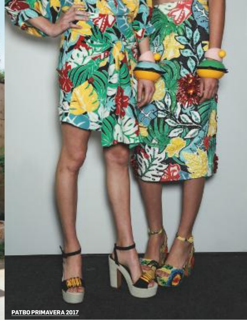
PATBO PRIMAVERA 2017