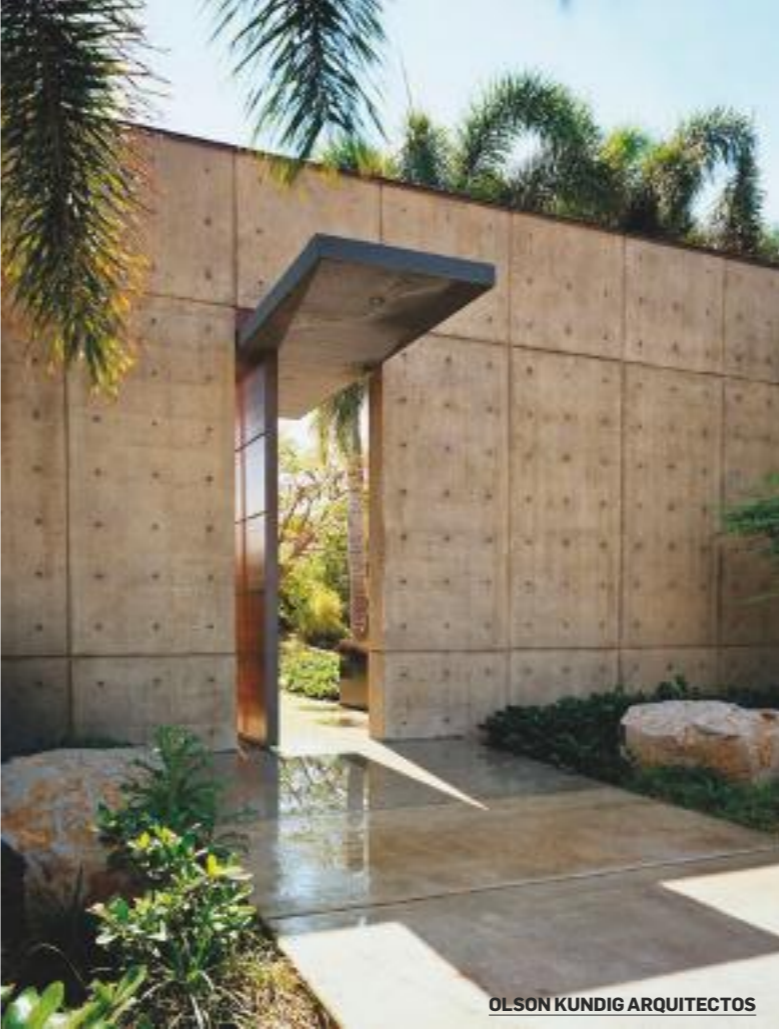
OLSON KUNDIG ARQUITECTOS