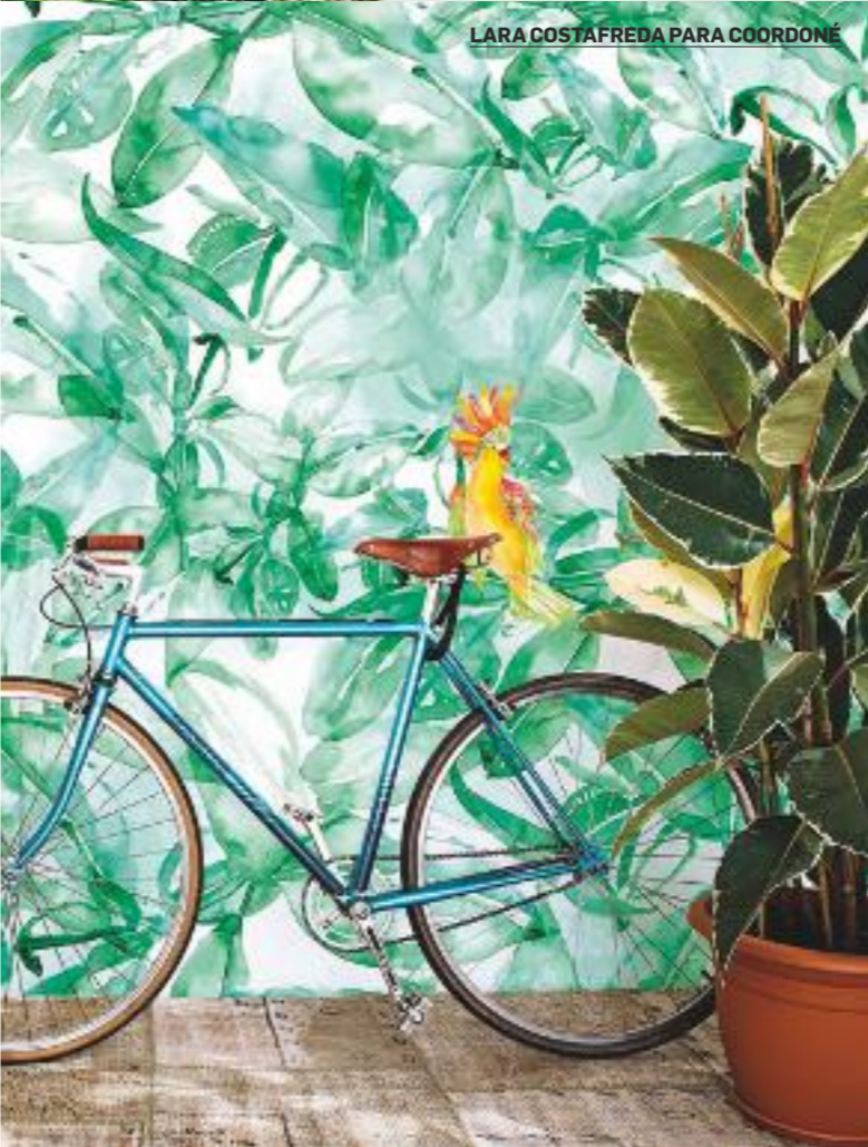
LARA COSTAFREDA PARA COORDONÉ