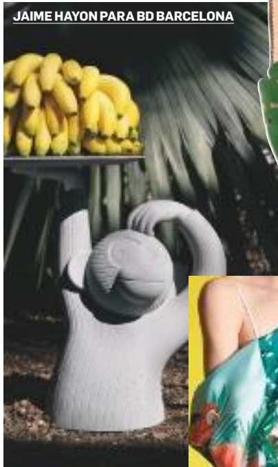
JAIME HAYON PARA BD BARCELONA